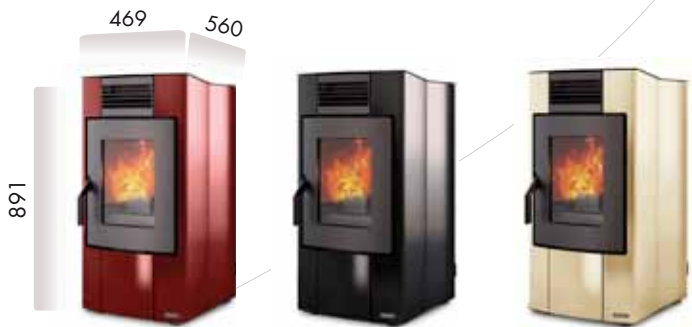
Bordeaux Bordeaux - Bordeaux Bordeaux - Burdeos