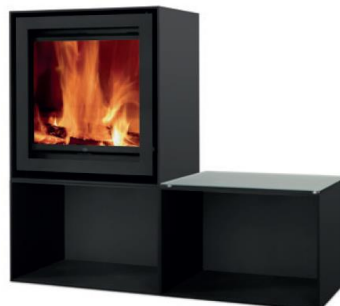
S600H + 2x Cube

MEDIDAS MEDIDAS / DIMENSIONS DIMENSIONS / MISURE