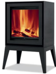
S600H + Spider

MEDIDAS MEDIDAS / DIMENSIONS DIMENSIONS / MISURE