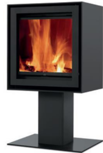
S600H + Square

MEDIDAS MEDIDAS / DIMENSIONS DIMENSIONS / MISURE