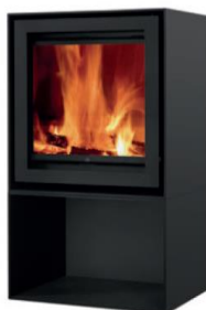
S600H + Cube

MEDIDAS MEDIDAS / DIMENSIONS DIMENSIONS / MISURE