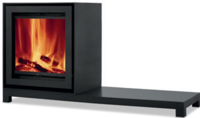
S600H + Table

MEDIDAS MEDIDAS / DIMENSIONS DIMENSIONS / MISURE